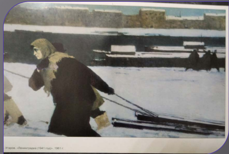
Улагос. «Ленинградка (1941 год)». 1961 г.